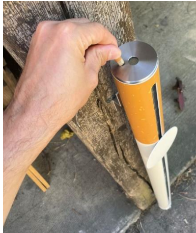
Ecrasez sur la plaque